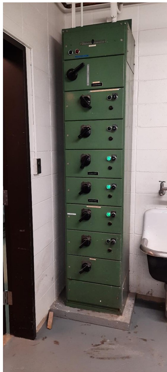
Centre de démarreurs CD5 Sous-Sol A