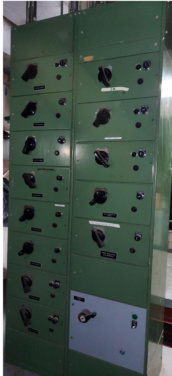
Centre de démarreurs CD3 Cabanon C (avant et arrière)