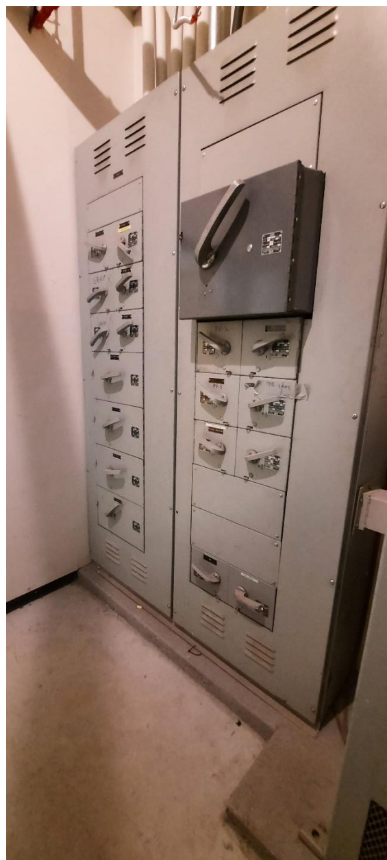
Panneau de distribution - PDC