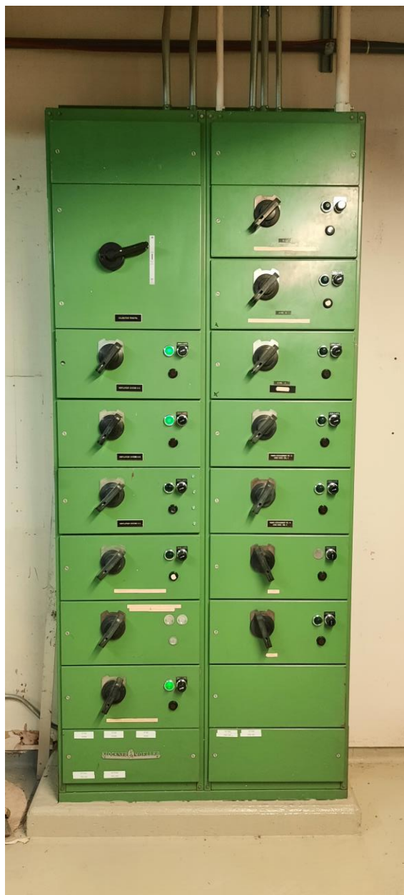
Centre de démarreurs CD4 Sous-Sol C