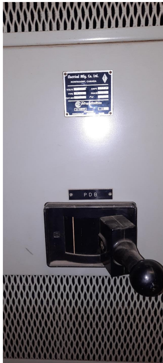
Panneau de distribution – PDB