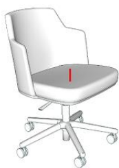
Fauteuils de visiteurs rotatif